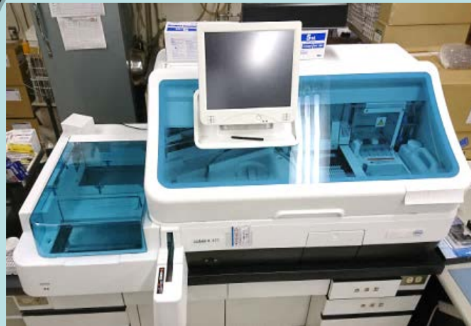
ホルモン・ウイルス分析装置