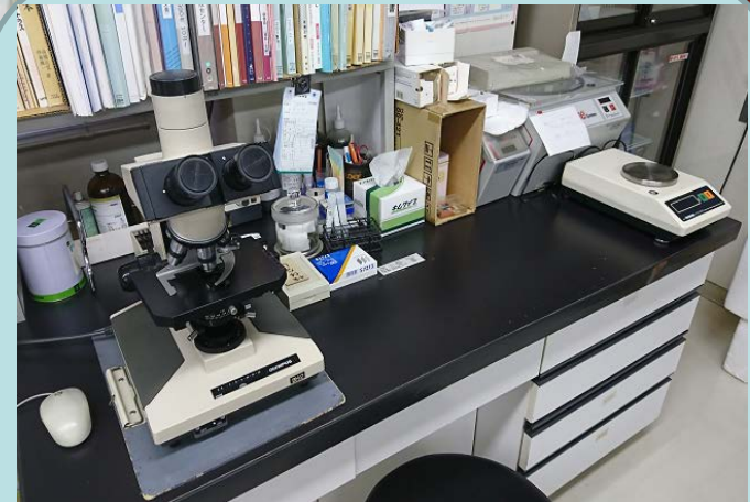
顕微鏡・輸血検査