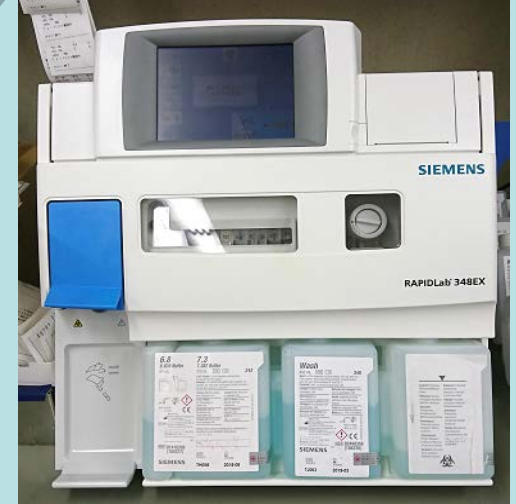
血液ガス分析装置